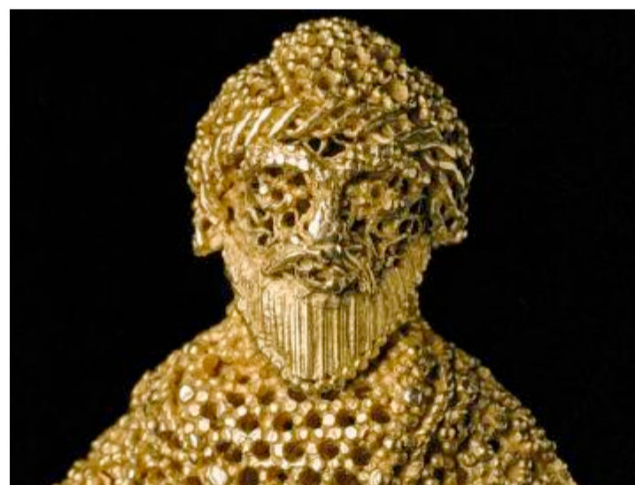
Echtheit wird geprüft: Islamische Goldfigur aus dem 10. oder 11. Jahrhundert, die sich in deutschem Besitz befindet.