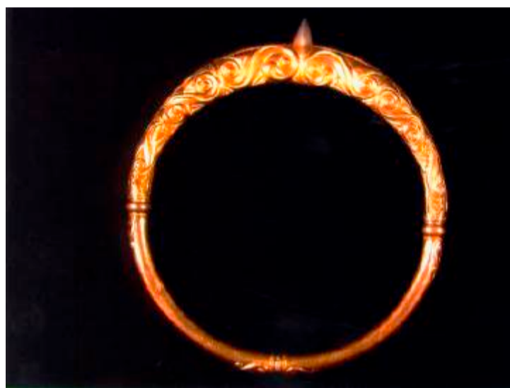
Echtheit nachgewiesen: Keltischer Halsreif aus der La Tène-Zeit um 500 v. Chr., der sich in amerikanischem Besitz befindet.