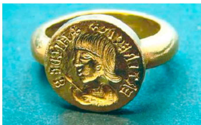
Echtheit nachgewiesen: Siegelring von König Childebert I. oder II.